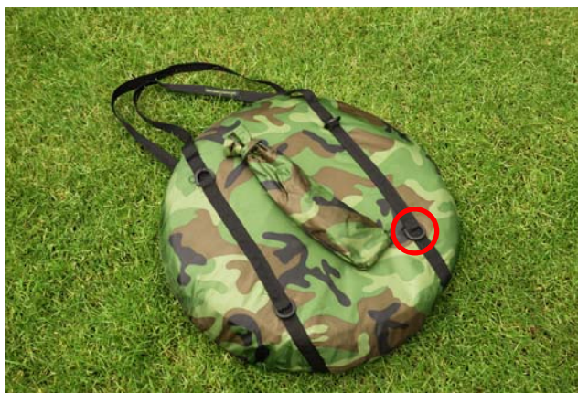
Figuur 1 Draagtas schuiltent Buteo

De schuiltent is van het type fold-out. Dat wil zeggen dat hij heel compact opgevouwen kan worden. Het voordeel hiervan is dat hij in een relatief compacte draagtas (figuur 1) opgeborgen kan worden. De afmetingen van de draagtas bedragen 53 cm bij 5 cm. De tent heeft een afmeting van 155 cm bij 115 cm bij 115 cm. Het gewicht van de tent is slechts 2500 gram inclusief draagtas en extra muskietengaas voor alle 4 de kijkgaten. Als extra worden standaard 12 lange grondpennen en 4 scheerlijnen meegeleverd (figuur 2). Hierdoor komt het totale gewicht van de complete set op 2900 gram. Aan een zijde van de draagtas zijn 4 praktische stevige D-ringen bevestigd (figuur 3). Deze kunnen gebruikt worden om bijvoorbeeld een camouflage net te bevestigen voor transport. Ook kunnen de D-ringen gebruikt worden voor bevestiging aan bijvoorbeeld een fotorugzak, waardoor het transport nog eenvoudiger wordt.