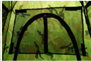
Figuur 11 Muskietengaas

Wil je dit muskietengaas niet gebruiken, dan kun je het volledig oprollen en vastzetten met de speciale lussen die hiervoor aanwezig zijn (figuur 5). Met deze lussen kun je ook de 'buitendeur' vastzetten, als je het muskietengaas gebruikt. Gebruik je de schuiltent niet als 'schuilplaats' om je te verschuilen voor dieren, dan kun je ook beide deuren hiermee gelijktijdig vastzetten. Deze optie zal alleen gebruikt worden als de schuiltent gebruikt wordt als 'schuilplaats' bij slecht weer, zoals regen, sneeuw en wind en je onder deze omstandigheden jezelf en je apparatuur hiertegen wilt.