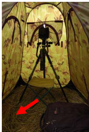
Figuur 13,14 Opstelling statief

Uiteraard is ook aan iedere zijde van de schuiltent een rits aangebracht voor een statiefpoot (figuur 12). Hierdoor ontstaat extra ruimte in de schuiltent. Aan ruimte is overigens geen gebrek. Naast statief en stoel is voldoende ruimte aanwezig voor het wegleggen van