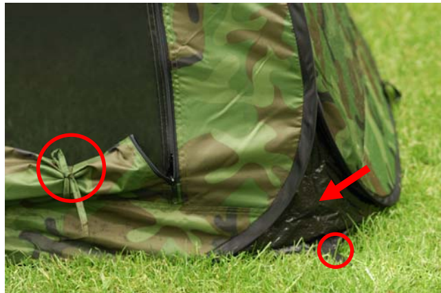
Figuur 5 Lussen en slikrand

aangenomen. Afhankelijk van de weersomstandigheden kan je ervoor kiezen de schuiltent met de lange grondpennen extra te verstevigen. Aan de onderzijde van de schuiltent zijn hiervoor 8 lussen bevestigd (figuur 5). Door de aluminium grondpennen voldoende ver in de grond te steken zullen zij niet opvallen. De onderzijde van de schuiltent is ook voorzien van een stevige slikrand (figuur 5 en 6), waardoor geen wind en regen onder de schuiltent zal doorslaan. Ook zullen oneffenheden in de ondergrond hierdoor niet voor problemen zorgen. Bij stevige wind kan je ook de 4 scheerlijnen vastzetten. Hierdoor zal de schuiltent zeer stabiel zijn. De bevestigingsogen (figuur 7) voor de scheerlijnen zijn op iedere hoek op 1,2 m bevestigd en zijn net als alle ritsen en sliders zwart, waardoor ze in het veld niet zullen opvallen.