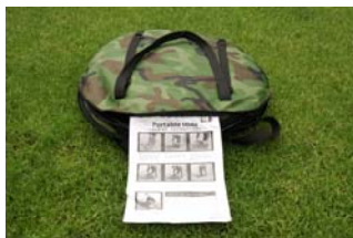
Figuur 8 Handleiding

Het opvouwen van de schuiltent vraagt even oefening. In de draagtas is een handleiding bevestigd waarop uitgelegd wordt hoe de schuiltent opgevouwen moet worden (figuur 8). Je kan voor deze methode kiezen, maar het kan ook anders. Vouw de schuiltent samen, zoals hij bij het