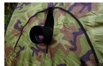
Figuur 15 Kijkgat

Het muskietennet kan gebruikt worden voor een extra afdichting van het kijkgat (figuur 15 en 16). Van binnenuit lijkt dit nauwelijks effect te hebben, maar als je van buitenuit kijkt zie je dat het wel degelijk goed werkt.