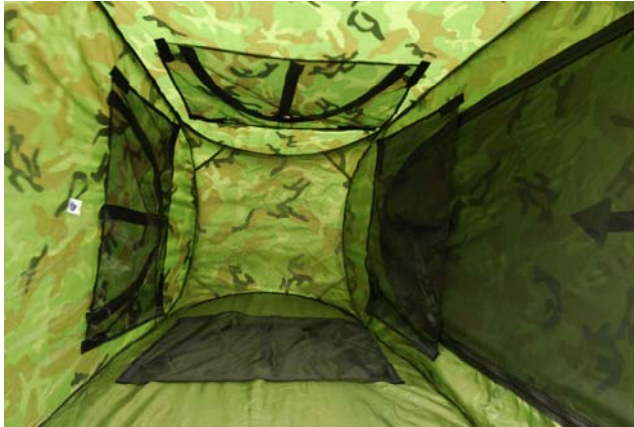
Figuur 9 Kijkopeningen met muskietengaas