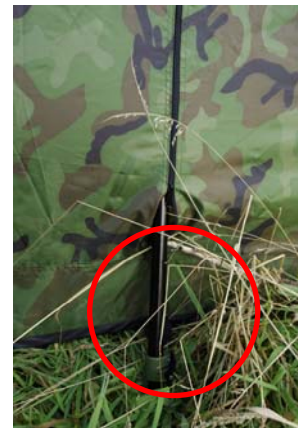
Figuur 12 Statiefpoot

bijvoorbeeld een fotorugzak (figuur 13 en 14). Er blijft dan voldoende beenruimte over. De schuiltent heeft geen grondzeil. Hierdoor kan het statief stevig aangedrukt worden met de bodem en ontstaat geen geritsel door het bewegen van de voeten over de grond.