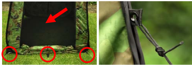
Figuur 6 Lussen en muskietengaas