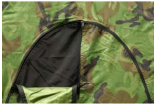
Figuur 10 Kijkopening